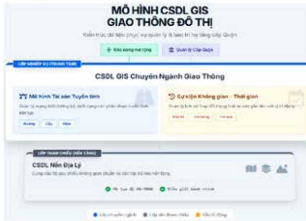
Hình 3. Mô hình CSDL GIS giao thông đô thị