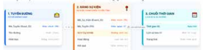
Hình 7. Mô hình dữ liệu tuyến - sự kiện - thời gian trong CSDL GIS quản lý HTĐB

Các hoạt động kiểm tra hiện trạng và bảo trì được tổ chức dưới dạng các bảng dữ liệu sự kiện độc lập, không gắn hình học trực tiếp mà liên kết với tuyến đường thông qua mã định danh và vị trí tương đối dọc tuyến (Hình 7). Việc tách riêng dữ liệu kiểm tra (Bảng 2) và dữ liệu bảo trì (Bảng 3) phản ánh đúng bản chất khác nhau của các quy trình quản lý và hỗ trợ lưu trữ dữ liệu theo không gian - thời gian.