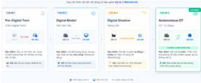
Hình 1. Phân loại Digital Twin

Bên cạnh đó, khái niệm bản sao số (Digital Twin - DT) cho hạ tầng đô thị đang được quan tâm như một hướng tiếp cận mới trong quản lý và hỗ trợ ra quyết định. Các nghiên cứu gần đây cho thấy DT không chỉ là mô hình trực quan hay 3D, mà trước hết là bài toán về nền tảng dữ liệu, trong đó GIS đóng vai trò lớp dữ liệu trung tâm bảo đảm tính chuẩn hóa, liên thông và quản lý theo không gian - thời gian. GIS là “nơi gặp gỡ” tự nhiên của dữ liệu về vị trí và thời gian và khi tích hợp dữ liệu không gian - thời gian, DT mới có thể phản ánh đầy đủ tính động của đô thị. Do đó, cho thấy nhu cầu xây dựng CSDL GIS làm nền tảng để từng bước hướng tới phát triển DT ở các cấp độ cao hơn (Hình 1) [5].