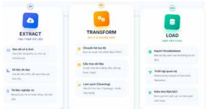
Hình 2. Quy trình xây dựng và tích hợp dữ liệu

Quy trình xây dựng CSDL GIS được thực hiện theo mô hình ETL (Extract - Transform - Load) nhằm bảo đảm chất lượng và tính nhất quán của dữ liệu (Hình 2).