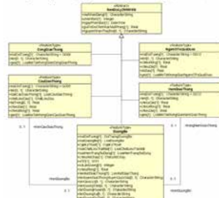
Hình 6. Lược đồ ứng dụng mô tả các lớp đối tượng địa lý trong gói dữ liệu giao thông [7]