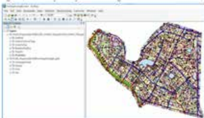
Hình 8. CSDL HTĐB quận Đống Đa (cũ), TP Hà Nội

Dữ liệu đầu vào gồm CSDL nền địa lý và dữ liệu HTĐB cấp quận (cũ), được thu thập từ các nguồn quản lý chính thống và khảo sát thực địa. Toàn bộ dữ liệu được chuẩn hóa về hệ tọa độ, cấu trúc thuộc tính và mã định danh theo đúng thiết kế CSDL đã đề xuất.